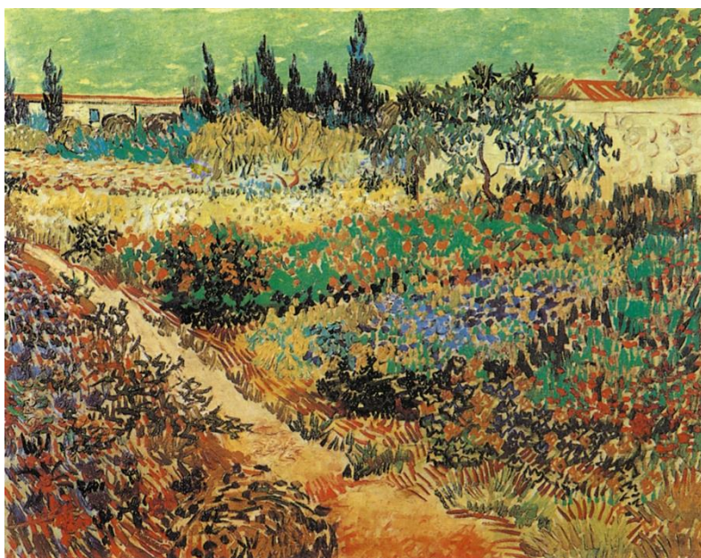
Vincent van Gogh, Cvjetni vrt sa stazom, ulje na platnu, 1888.

Promotrite sliku Vincenta van Gogha Cvjetni vrt sa stazom . Pronađite gdje se sve na njoj crvena i zelena boja nalaze jedna pored druge. Pronađite na slici još