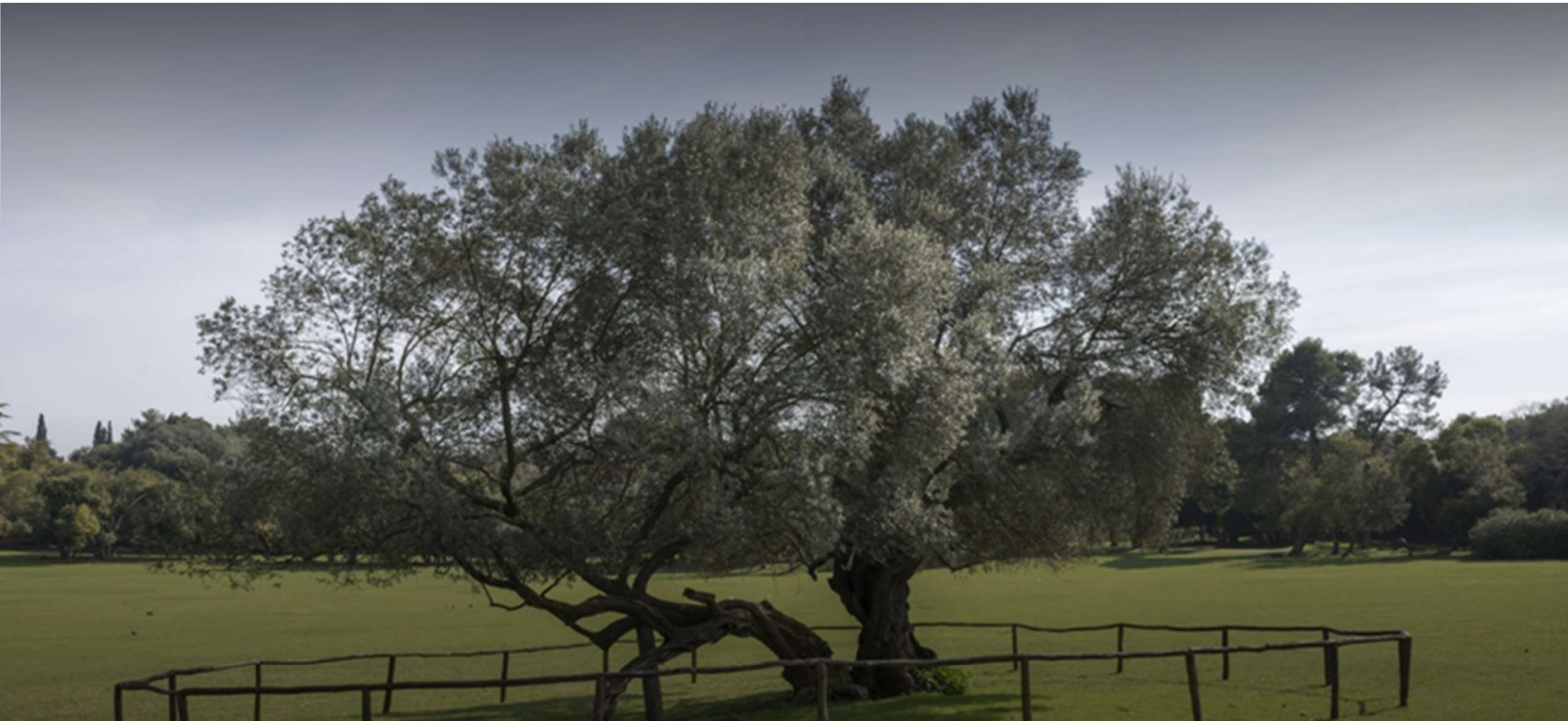
Der alte Olivenbaum ist einer der ältesten Olivenbäume im Mittelmeer, was durch eine Untersuchung der Holzprobe auf dem Institut Ruđer Bošković in Zagreb in den 60er Jahren des letzten Jahrhunderts bestätigt wurde.