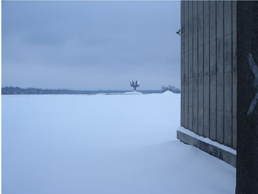
POGLED NA SPOMENIK U OBLIKU CVIJETA

ZADATAK JE BIO OBIĆI MEMORIJALNI CENTAR I ODGOVORITI NA PITANJA VEZANA ZA DOGAĐANJA U LOGORU JASENOVAC.